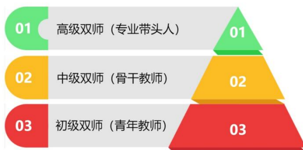
如图1 教师培养对应目标

在“双师型”教师团队构建过程中，学校制定了递进式的教师层级认定培养方案（如图1教师培养对应目标）。对不同层级教师的思想政治素养、教育教学理论、专业技能水平都进行了相应的规划。专业教师只要满足其中相应条件，经个人申请，教学专业部初审、教务科审核、学校召开专题会议对申请材料进行终审，通过即可以认定为相应层级。并成为上一层级的培养对象。