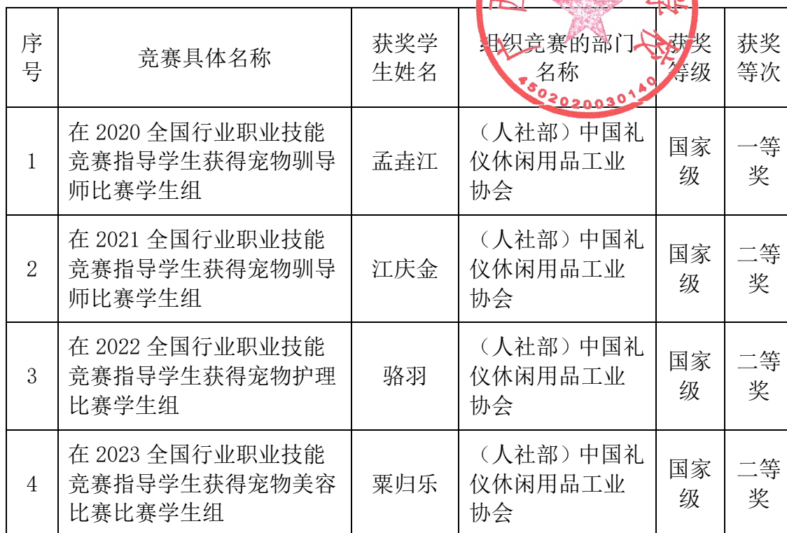
学生参加专业技能大赛统计表